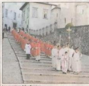
La processione di San Ponziano

più cospicui sono quelli detti "Ferro di cavallo maggiore". Per i profani, comunque, sempre di pipistrelli trattasi e quindi di specie protette che aggiungono un valore in più alla già inestimabile suggestione di quel percorso. Di certo, una scoperta del genere, non potrà passare inosservata a quanti aspettano il totale recupero del tracciato. Gli utenti "privilegiati" del percorso, dovrebbero essere secondo le intenzioni