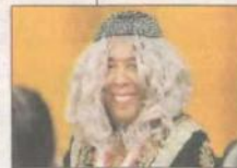
Ellen Stewart, la Mama, consigliere a Spoleto per la sua scomparsa

Addio alla Mama, scelse Spoleto per il suo centro culturale